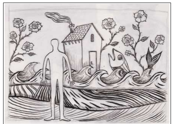
Différents plans de décors en 2D, à l'image d'un théâtre de papier. La silhouette représente le manipulateur.

Les différents éléments de décor s'accumulent et composent l'univers de Sacha qui se retrouve immergée dans les souvenirs de son grand-père. Le spectateur voit à travers les yeux de l'enfant les souvenirs de Papi embellis, sublimés voire surréalistes.